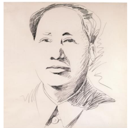
Andy Warhol, Mao, 1973, Grafit auf Papier, 92,1 x 92,7 cm © The Andy Warhol Foundation for the Visual Arts, Inc./ Bildrecht, Wien, 2018, Foto: Fondation Hubert Looser