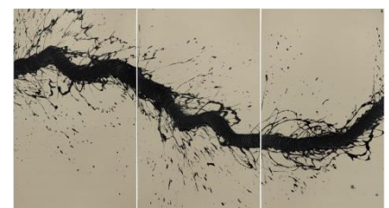
Fabienne Verdier, Walking / Painting, 2018, Acryl auf Moulin-du-Gué-Papier, 150 x 274 cm © Bildrecht, Wien, 2018, Foto: Fondation Hubert Looser