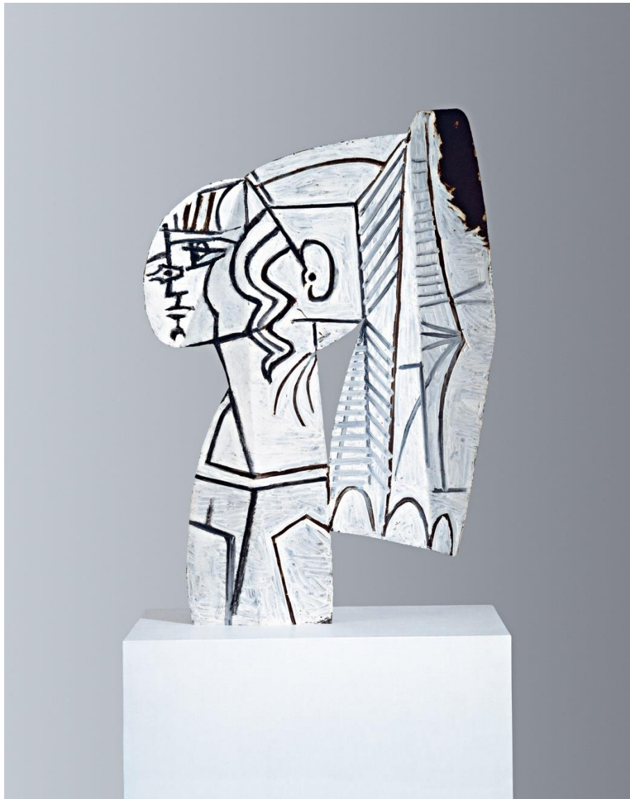
Pablo Picasso, Sylvette, 1956, beidseitige Ölmalerei auf ausgeschnittenem Metallblech, 69,9 x 47 x 1 cm © Succession Picasso / Bildrecht, Wien, 2018. Foto: Fondation Hubert Looser

Skulpturen und Arbeiten auf Papier. Sammlung Hubert Looser