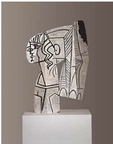
Pablo Picasso Sylvette, 1954 beidseitige Ölmalerei auf ausgeschnittenem Metallblech 69,9 x 47 x 1 cm