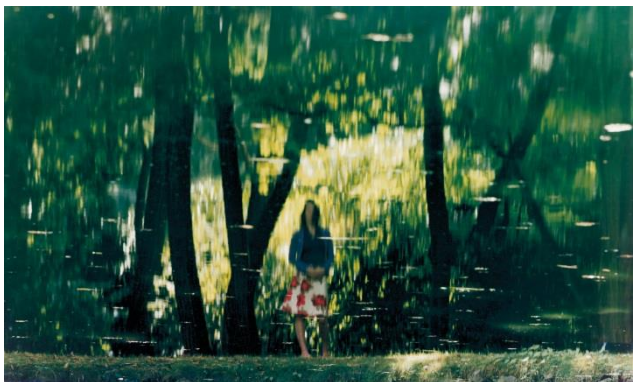
Axel Hütte, Portrait#22 , 2005, 157 x 237 cm, C-Print

lebt und arbeitet in Düsseldorf, Deutschland