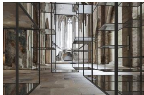
Eva Schlegel, Visualisierung der Ausstellung in der Dominikanerkirche 2018 , Courtesy Galerie Krinzinger © Eva Schlegel/Bildrecht, 2017