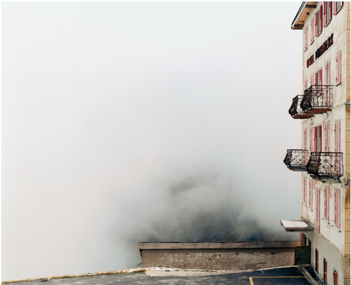
Axel Hütte Furkablück, Schweiz, 1994 C-Print 187 x 213 cm