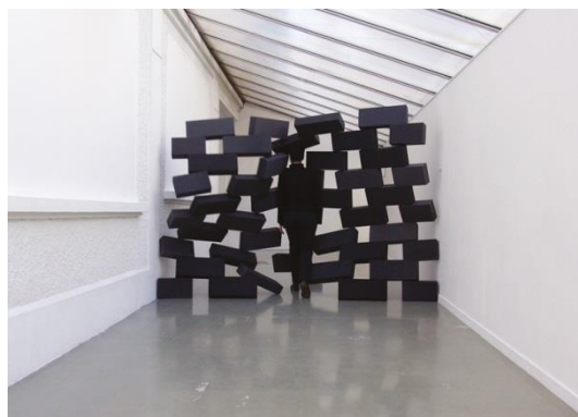
Perrine Lacroix COLLAPSED WALL , La Roche-sur-Foron Frankreich, 2012 55 Ziegel aus Schaumstoff 20 x 10 x 50 cm © Perrine Lacroix