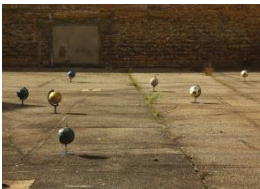
Perrine Lacroix, DODGE BALLS Gefängnis Saint-Paul, Lyon, Frankreich, 2012 8 Skulpturen aus Stahl und Bällen, unterschiedliche Größen