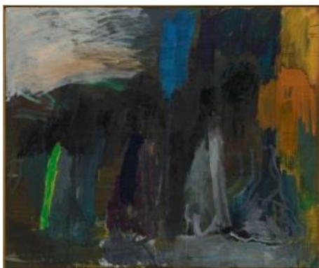
Per Kirkeby Ohne Titel , 1986 Öl auf Leinwand, 200 x 240 cm © Per Kirkeby, Courtesy Galerie Michael Werner Märkisch Köln & New York, Foto: Jörg von Bruchhausen

lebt und arbeitet in Kopenhagen, Dänemark, und Arnasco, Italien