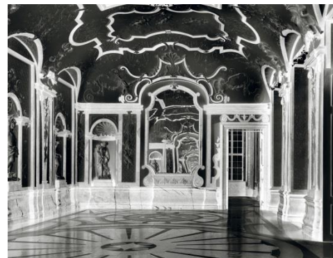
Axel Hütte Belvedere-2, Austria , 2015 Schwarz-Weiß-Print 77 x 92 cm