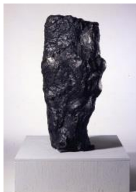
Per Kirkeby Nyt Læsø-hoved (dt. Neuer Læsø Kopf ), 1984 Bronze 115 x 47 x 61 cm © Per Kirkeby