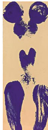
Yves Klein ANT 37 , ca. 1960 reines Pigment und Kunstharz auf Papier 79 x 29,5 cm © The Estate of Yves Klein c/o Bildrecht, Wien, 2017