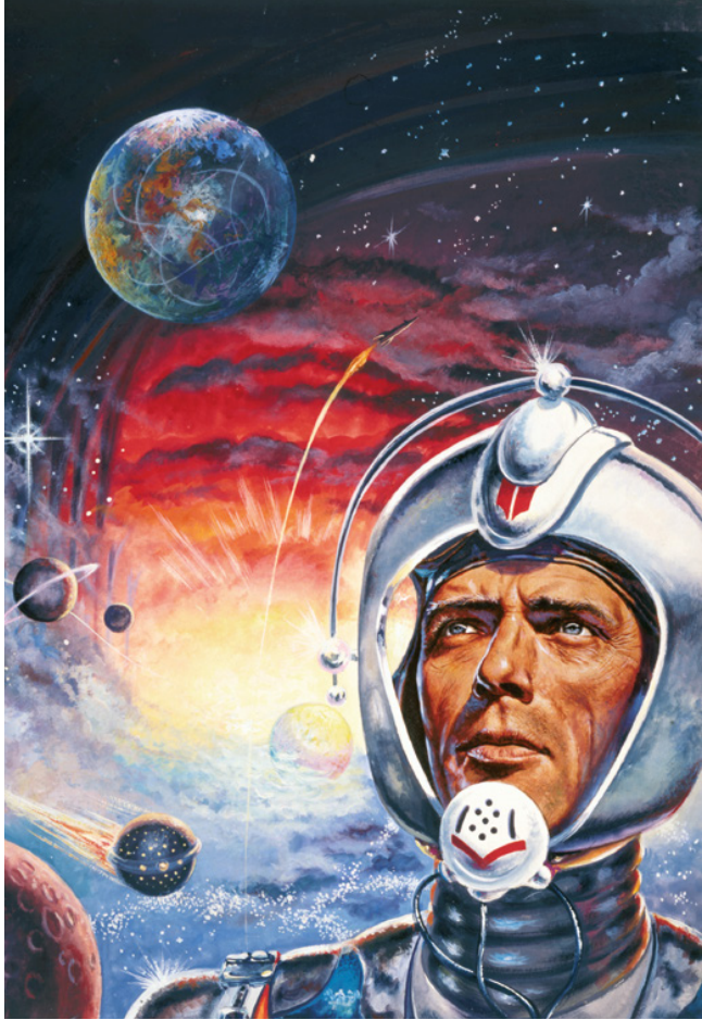
Credit: Johnny Bruck, Der Unsterbliche. Ein ganzes Sonnensystem vom Untergang bedroht – nur Perry Rhodan kann die Rettung bringen, (Detail) Nr. 19 aus der Serie Perry Rhodan, der Erbe des Universums, Covergestaltung © Pabel-Moewig Verlag GmbH