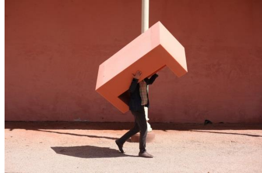
Josef Trattner, Donaueschingen Schloss Fürstenberg , 2016 © Josef Trattner, Foto Maciej Chioch