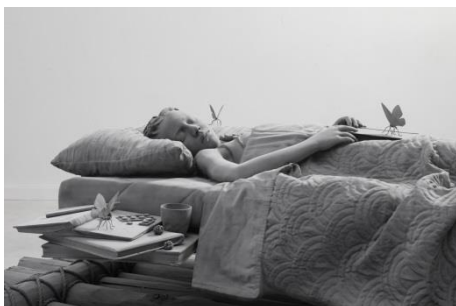
Hans Op de Beeck, Sleeping Girl , 2018 (Detail) Skulptur aus Polyester, Aluminum und Beschichtung, 210 x 100 x 76 cm © Studio Hans Op de Beeck / Bildrecht, Wien, 2018