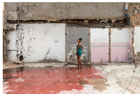
Teresa Margolles, Berenice, Pista de Baile del Bar Tlaquepaque , 2016 Fotografie, 180 x 120 cm, Foto: Teresa Margolles