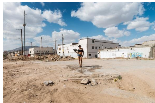
Teresa Margolles, Scarlett, Pista de Baile del Club La Cruda , 2016 Fotografie, 180 x 120 cm

In Kooperation mit AIR - ARTIST IN RESIDENCE Niederösterreich