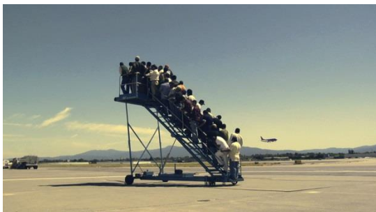
Adrian Paci, Centro di permanenza temporanea , 2007 (Film Still) Video, 5:30 Min, Courtesy der Künstler, kaufmann repetto, Mailand / New York und Galerie Peter Kilchmann, Zürich, Foto: Adrian Paci