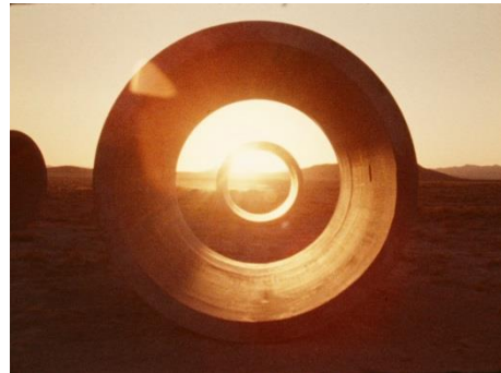
Nancy Holt, Sun Tunnels , 1978 (Film Still) 16 mm Film auf HD Video, 26:31 Min, Farbe, Ton