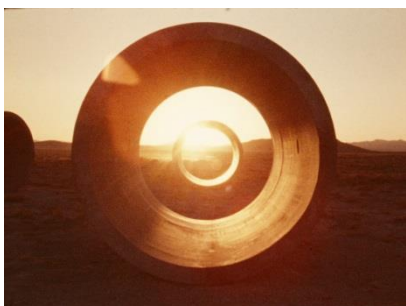
Nancy Holt, Sun Tunnels, 1978 (Film Still) 16 mm Film auf HD Video, 26:31 Min, Farbe, Ton Courtesy of the Holt/Smithson Foundation and Electronic Arts Intermix (EAI), New York