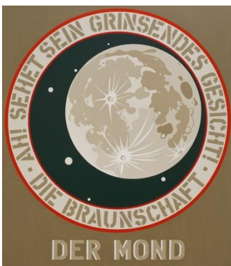
Robert Indiana, Der Mond - Die Braunschafft , 1969 Acryl auf Leinwand, 203 x 178 cm © Bildrecht, Wien, 2018 Foto: mumok - Museum moderner Kunst Stiftung Ludwig Wien Leihgabe der Österreichischen Ludwig-Stiftung