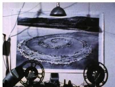
Robert Smithson, Spiral Jetty , 1970 (Film Still) 16 mm Film auf Video, 35 Min, Farbe, Ton