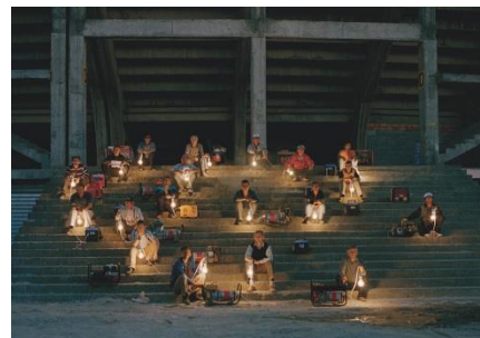
Adrian Paci, Turn on , 2004 (Film Still) Video, 3:33 Min, Courtesy der Künstler, kaufmann repetto, Mailand / New York und Galerie Peter Kilchmann, Zürich, Foto: Adrian Paci