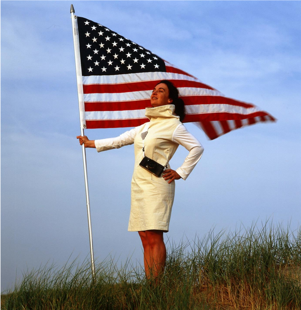
Alexandra Mir, First Woman on the Moon , 1999 [Film Still], Video, 14:08 Min, Farbe, Ton