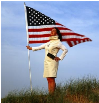
Alexandra Mir, First Woman on the Moon , 1999 (Film Still) Video, 14:08 Min, Farbe, Ton