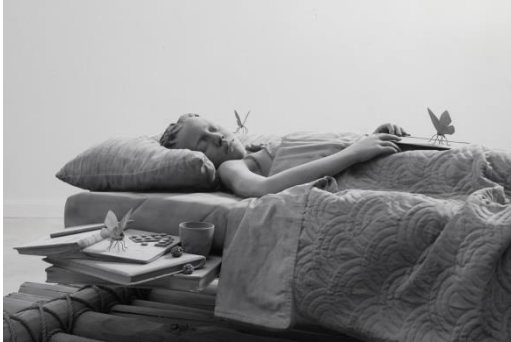
Hans Op de Beeck, Sleeping Girl , 2018 (Detail) Skulptur aus Polyester, Aluminium und Beschichtung, 210 x 100 x 76 cm © Studio Hans Op de Beeck / Bildrecht, Wien, 2018