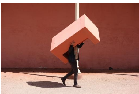
Josef Trattner, Donaueschingen Schloss Fürstenberg , 2016 © Josef Trattner, Foto Maciej Chioch