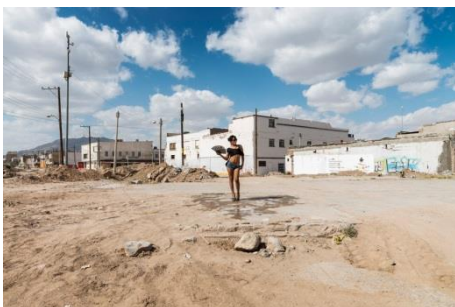
Teresa Margolles, Scarlett, Pista de Baile del Club La Cruda , 2016 Fotografie, 180 x 120 cm, Foto: Teresa Margolles

Kuratoren: Florian Steininger und Andreas Hoffer