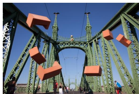
Josef Trattner, Budapest , 2016