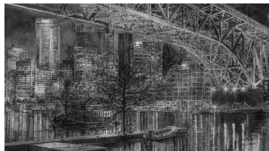
Hans Op de Beeck, Night Time , 2015 (Film Still) Full HD Video, 19:20 Min, Musik © Studio Hans Op de Beeck / Bildrecht, Wien, 2018