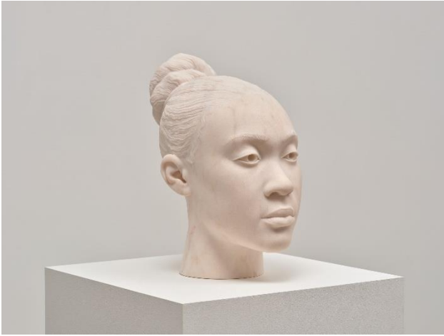
Thomas J Price, Through a Steady Gaze , 2023 © Thomas J Price, Courtesy the artist and Hauser & Wirth, Photo: Keith Lubow