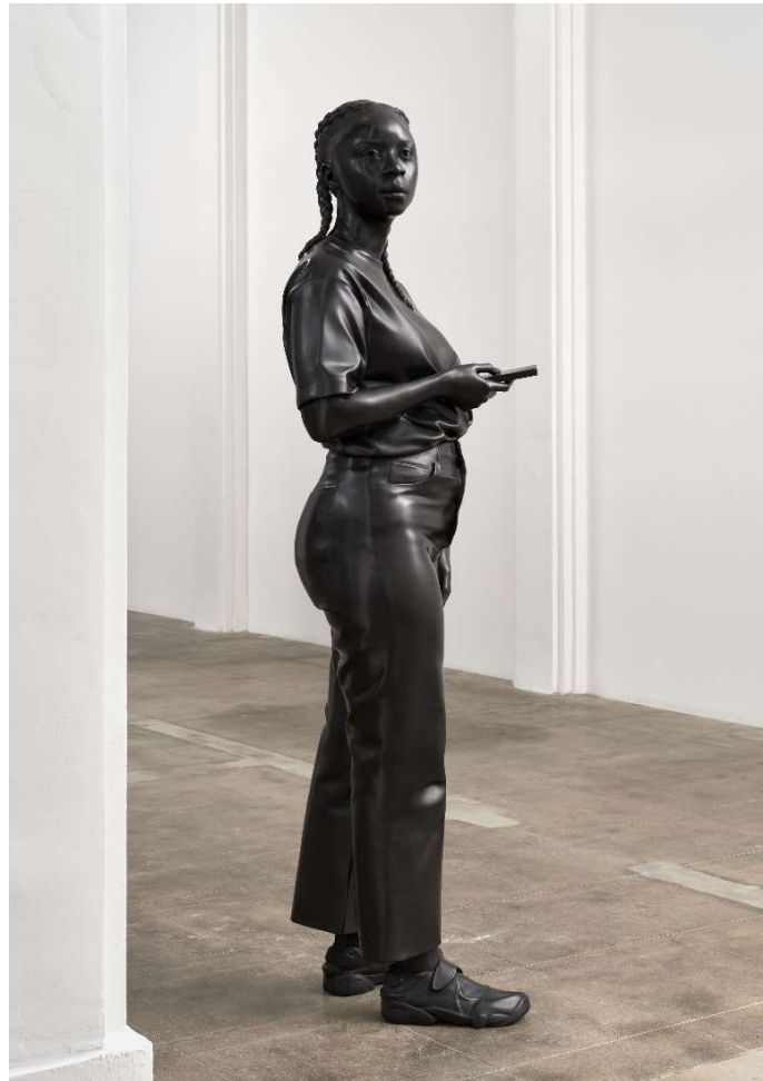
Thomas J Price, A Place Beyond, 2023 © Thomas J Price, Courtesy the artist and Hauser & Wirth, Photo: Keith Lubow

PRESSEBILDER: https://celum.noeku.at/pinaccess/showpin.do?pinCode=KunsthalleKrems2024