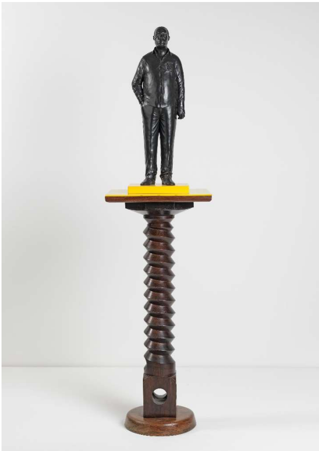
Thomas J Price, Man on a Horse (Kings Avenue) , 2011 © Thomas J Price, Courtesy the artist and Hauser & Wirth, Photo: Ken Adlard