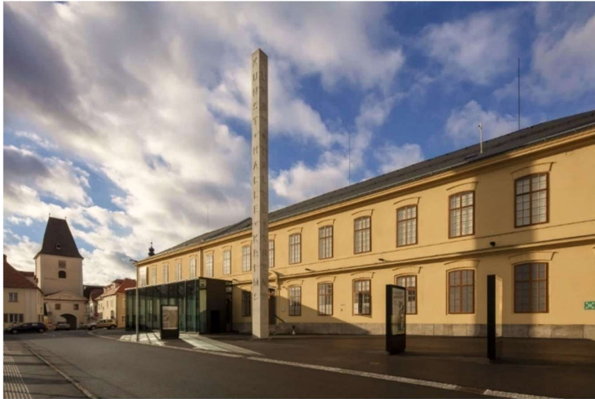
Kunsthalle Krems

Die Kunsthalle Krems ist das niederösterreichische Ausstellungshaus für zeitgenössische, internationale Kunst. Die Genres reichen von Malerei über Fotografie und Skulptur bis hin zu Medienkunst. In ihrer Programmatik gibt die Kunsthalle Krems der kritischen Auseinandersetzung mit gesellschaftsrelevanten Themen Raum. Sie lebt Heterogenität, Diversität, Solidarität, Toleranz, Meinungsfreiheit und Weltoffenheit und wird ihrem gesellschaftlichen, demokratie- und bildungspolitischen Anspruch mit ihren Ausstellungen und Veranstaltungen gerecht.