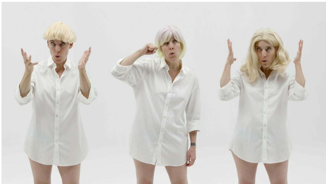
Candice Breitz, Whiteface (filmstill), 2022, Commissioned by the Museum Folkwang with support from the Kunsthalle Baden-Baden

In „Whiteface“ macht sich die Künstlerin diese Archivistimmen zu Eigen und stellt, mit wechselnden Perücken ausgestattet, die Bedingungen des Weißseins in den Mittelpunkt. Der Film ist ein Porträt der in Panik geratenen Weißen und persifliert diese absurde Angst. Die bewusst theatralische Darbietung der Künstlerin lenkt die Aufmerksamkeit auf die Konstruiertheit des Weißseins und anderer rassifizierter Kategorien.