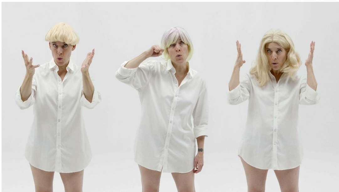
Candice Breitz, Whiteface (filmstill), 2022, Commissioned by the Museum Folkwang with support from the Kunsthalle Baden-Baden

In „Whiteface“ macht sich die Künstlerin diese Archivistimmen zu Eigen und stellt, mit wechselnden Perücken ausgestattet, die Bedingungen des Weißseins in den Mittelpunkt. Der Film ist ein Porträt der in Panik geratenen Weißen und persifliert diese absurde Angst. Die bewusst theatralische Darbietung der Künstlerin lenkt die Aufmerksamkeit auf die Konstruiertheit des Weißseins und anderer rassifizierter Kategorien.