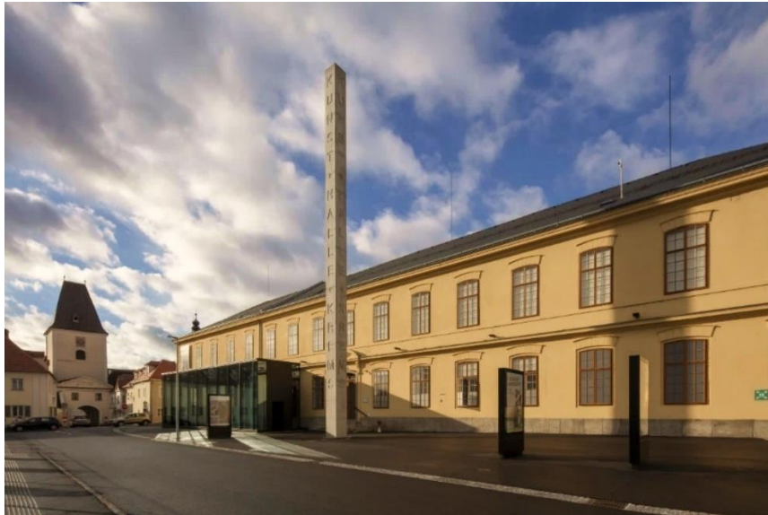
Kunsthalle Krems

Die Kunsthalle Krems ist das niederösterreichische Ausstellungshaus für zeitgenössische, internationale Kunst. Die Genres reichen von Malerei über Fotografie und Skulptur bis hin zu Medienkunst. In ihrer Programmatik gibt die Kunsthalle Krems der kritischen Auseinandersetzung mit gesellschaftsrelevanten Themen Raum. Sie lebt Heterogenität, Diversität, Solidarität, Toleranz, Meinungsfreiheit und Weltoffenheit und wird ihrem gesellschaftlichen, demokratie- und bildungspolitischen Anspruch mit ihren Ausstellungen und Veranstaltungen gerecht.