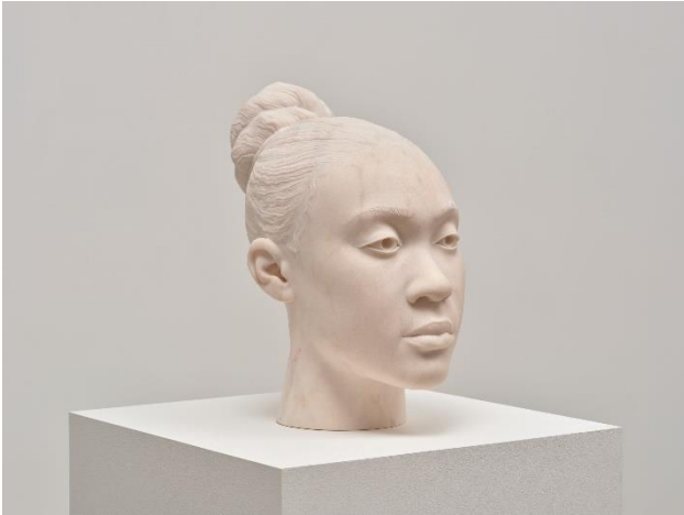
Thomas J Price, Through a Steady Gaze , 2023 © Thomas J Price, Courtesy the artist and Hauser & Wirth, Photo: Keith Lubow