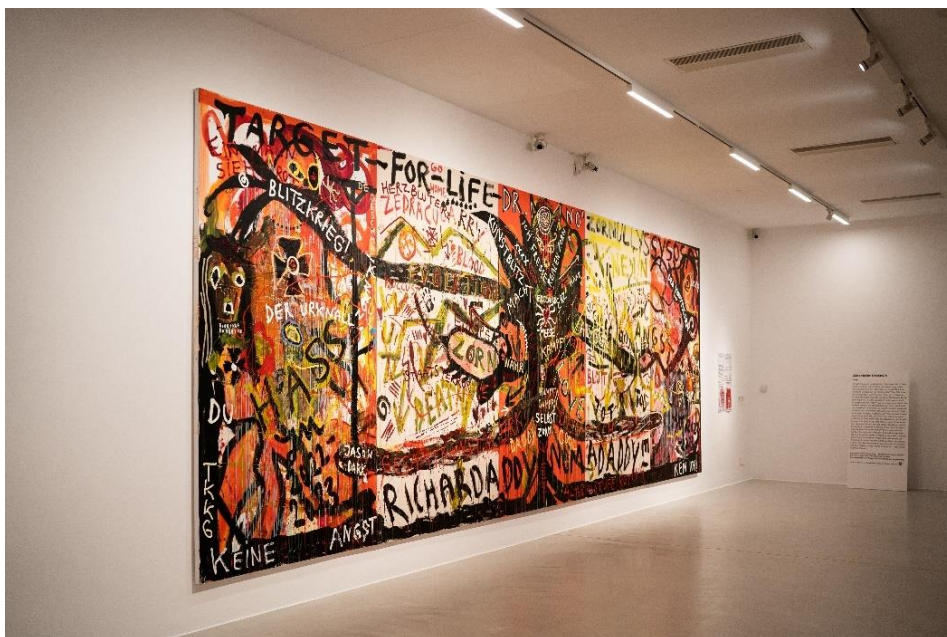
Jonathan Meese, „GESAMTKUNSTWERK ZORN“ (REIFEZEUGNIS „BABYZORNUSSUS“), 2023