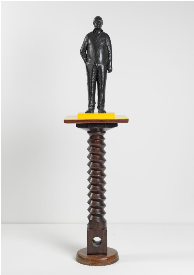
Thomas J Price, Man on a Horse (Kings Avenue) , 2011 © Thomas J Price, Courtesy the artist and Hauser & Wirth, Photo: Ken Adlard