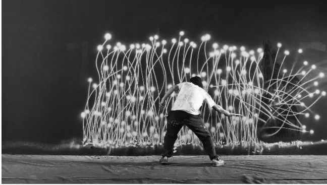
Robin Rhode, Harvest , 2005 Digitale Animation 03:45 Min