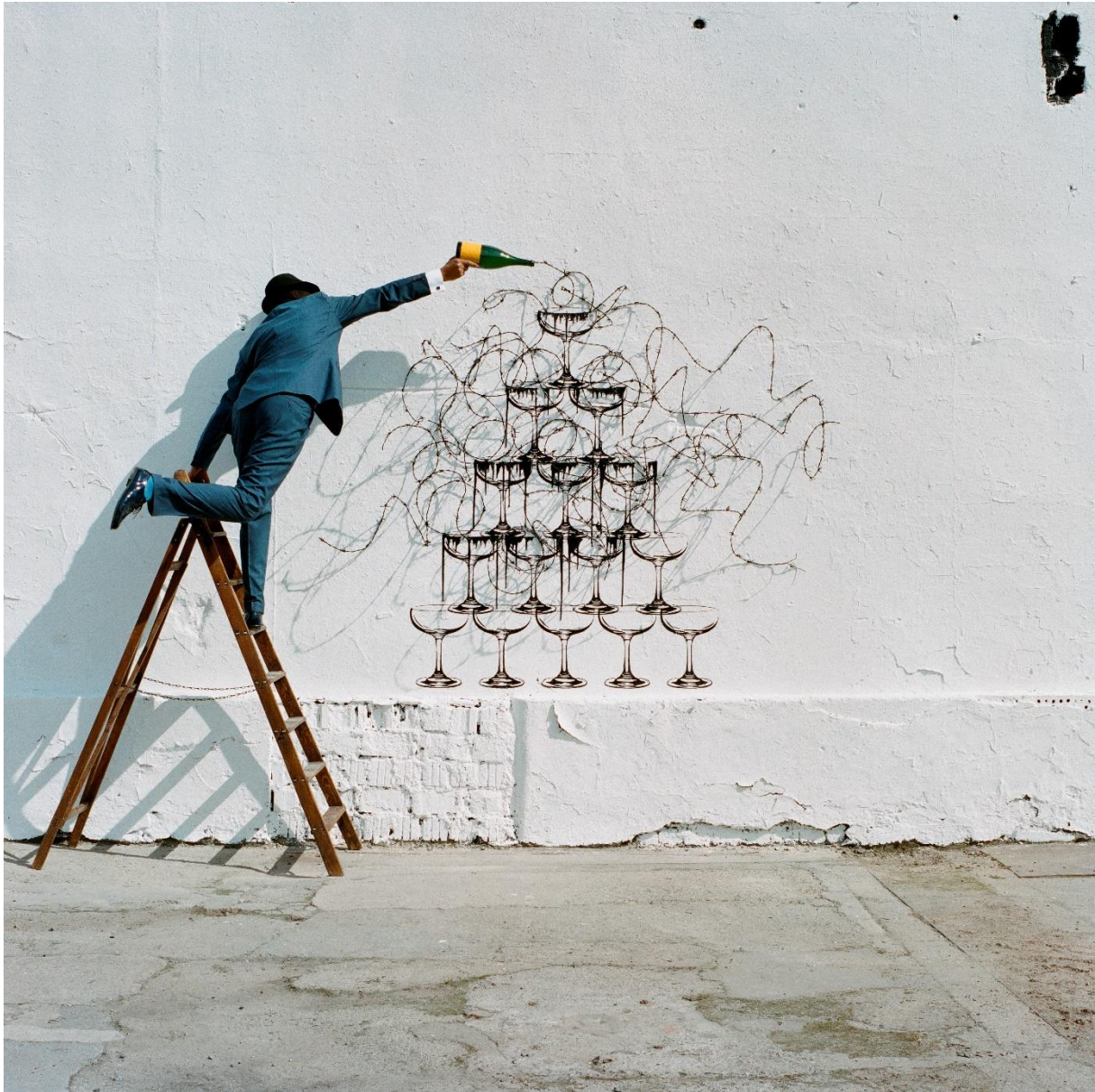
Robin Rhode, The Fountain, 2011, Courtesy of the Ekhard Collection and the artist © Robin Rhode

ROBIN RHODE. MEMORY IS THE WEAPON 14.03.2020 – 01.11.2020 VERLÄNGERT! Kunsthalle Krems