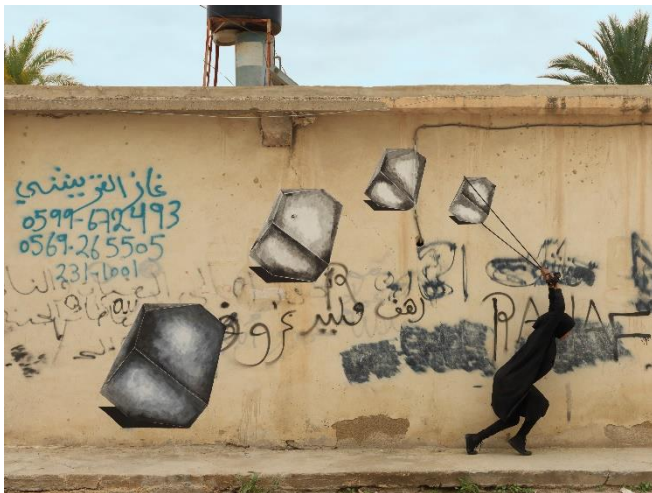
Robin Rhode, Melancholia , 2019 4 C - Prints each: 54,6 x 72,6 cm