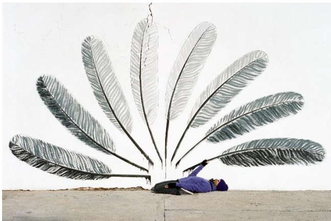
Robin Rhode, Twilight , 2012 8 individual C - prints each: 41.59 cm x 61.59 cm (framed)