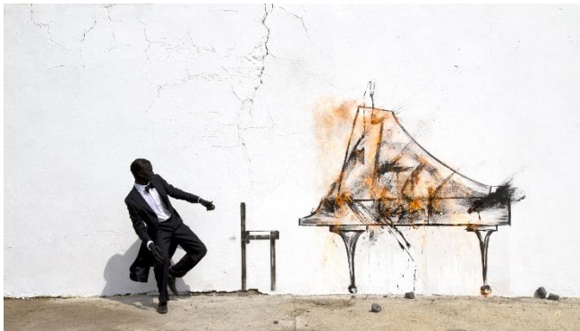
Robin Rhode, Piano Chair , 2011 Digitale Animation 03:53 Min