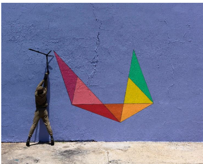
Robin Rhode, Paradise , 2016 8 individual C - prints each: 56 cm x 70 cm / 58,6 cm x 72,6 cm (framed)