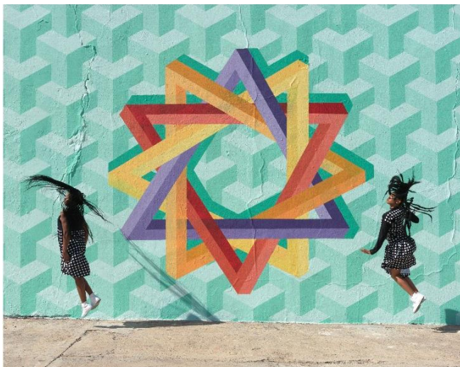
Robin Rhode, Delta , 2018 4 C-prints each: 58,6 x 72,6 cm