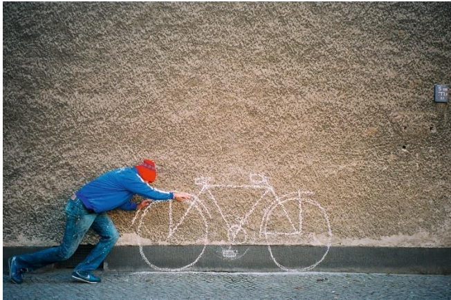
Robin Rhode, Classic Bike , 2002 12 Diasecs each: 29,8 x 45,7 cm